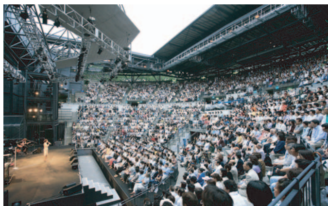
施設内観(舞台横から客席を見る：屋根開状態)

改修項目の1つとして、施設北側の前庭の整備が挙げられます。この前庭は、イベント時に観客のためのホワイエのような場所となりますが、今回の改修では、以前あった築山を撤去し、より広い平場を確保すると同時に、外灯を更新、前庭の中央に高木を植栽するなどして、機能性と快適性を向上させるための整備を行いました。整備後は、小イベントなども行える広場の空間として活用されています。